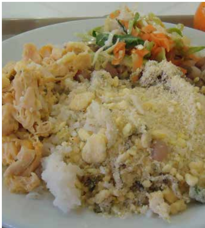
PROGRAMA SABOR E RENDA, AULA DE CULINÁRIA, GUARUJÁ

O Observatório Litoral Sustentável elaborou um mapa interativo com os elementos que compõem o sistema de segurança alimentar e nutricional na Baixada Santista. O mapa mostra no território os equipamentos de acesso ou de aquisição de alimentos, como restaurantes populares, banco de alimentos, mercados públicos e feiras livres, bem como feiras organizadas por produtores e por pescadores artesanais para venda direta ao público. O mapa apresenta também a localização das organizações de produtores da agricultura familiar, os produtos que oferecem e a forma de contato, que podem ser acessadas pelo poder público e por compradores institucionais, como hotéis e restaurantes e, eventualmente pela população em geral. Mostra, ainda, o perfil de cada município em relação à SAN, desde os órgãos responsáveis pela gestão da política de segurança alimentar até os programas existentes, equipamentos de acesso e aquisição de alimentos.